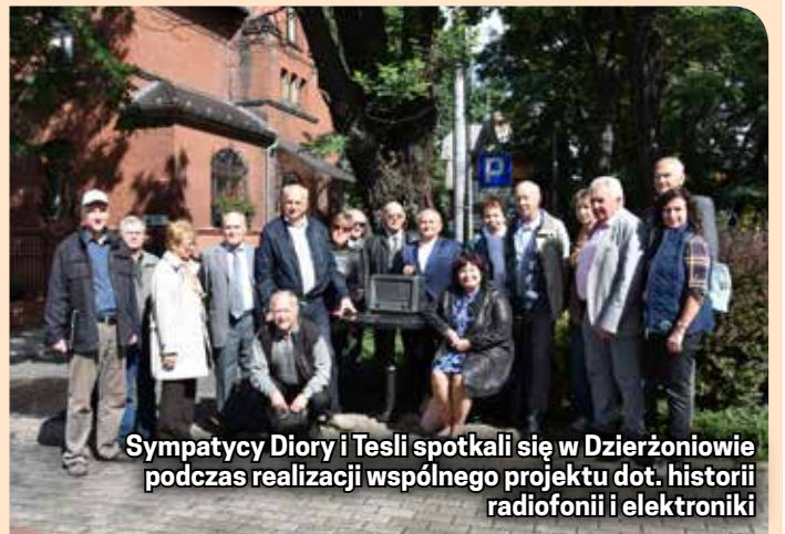
Sympatycy Diory i Tesli spotkali się w Dzierżoniowie podczas realizacji wspólnego projektu dot. historii radiofonii i elektroniki

16 i 17 września 2022 r. w Dzierżoniowie gościliśmy dawnych pracowników i sympatyków Zakładów Radiowych Tesla Lanškroun, którzy spotkali się z dawnymi pracownikami i sympatykami Zakładów Radiowych DIORA. Wystuchali oni wykładu dot. działalności Zakładów Radiowych Diora, zwiedzili Muzeum Miejskie Dzierżoniowa i poznali najważniejsze zabytki naszego miasta. W ramach projektu przygotowano folder dotyczący wybranych radioodbiorników z dzierżoniowskiego zakładu.