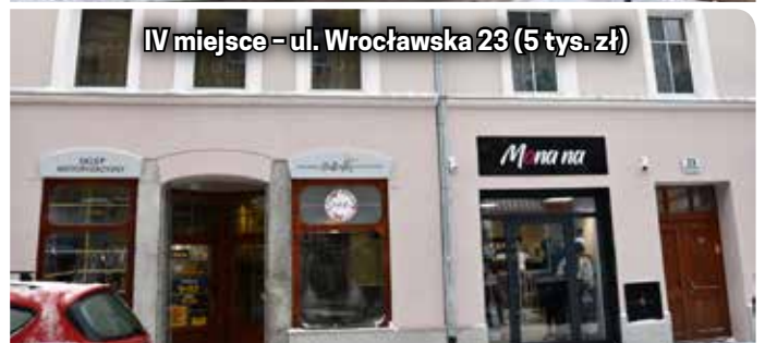
IV miejsce - ul. Wrocławska 23 (5 tys. zł)