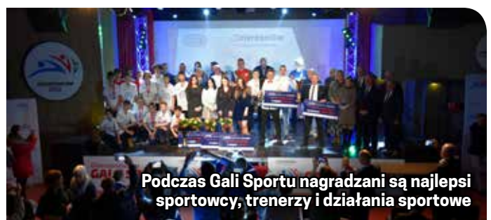
Podczas Gali Sportu nagradzani są najlepsi sportowcy, trenerzy i działania sportowe

gulaminem, należy przestać w formie elektronicznej na adres e-mail: mpisulak@um.dzierżoniow.pl.