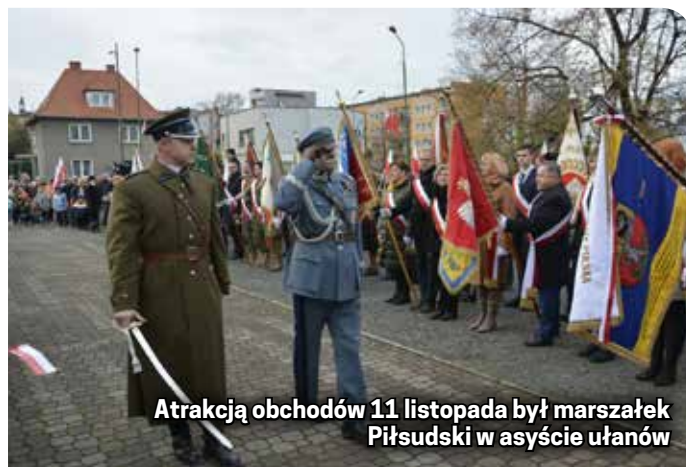
Atrakcją obchodów 11 listopada był marszałek Piłsudski w asyście ułanów

W ramach miejskich obchodów 104. rocznicy odzyskania niepodległości podczas pikniku na placu targowym odbył się też Dzierżoniowski Bieg Niepodległości. Jego trasa wynosiła 1100