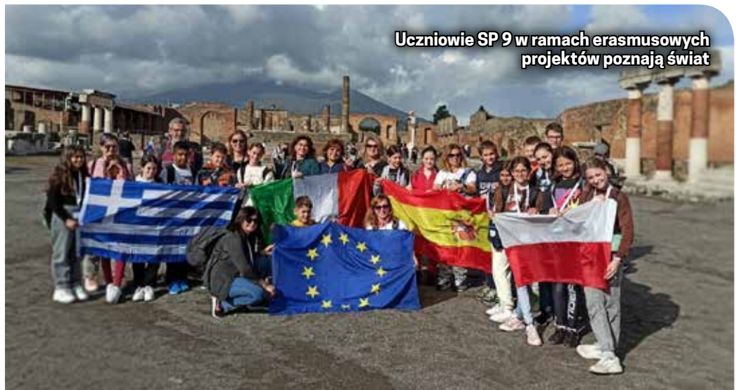
Uczniowie SP 9 w ramach erasmusowych projektów poznają świat

Strona internetowa projektu: https://sp9poland.wixsite.com/scientists