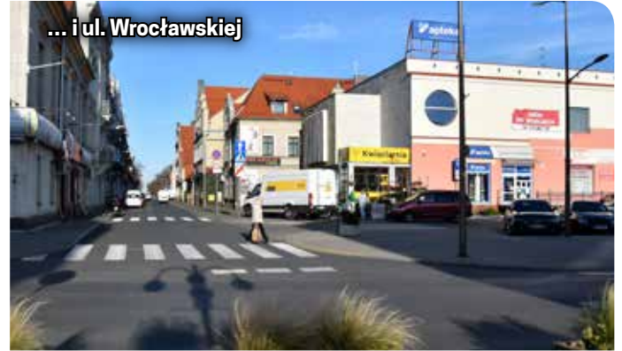
... i ul. Wrocławskiej