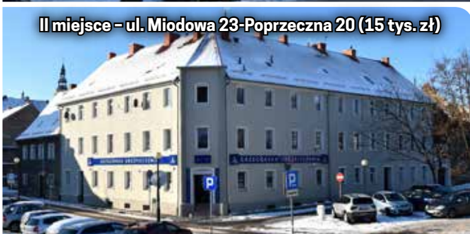
II miejsce - ul. Miodowa 23-Poprzečna 20 (15 tys. zł)