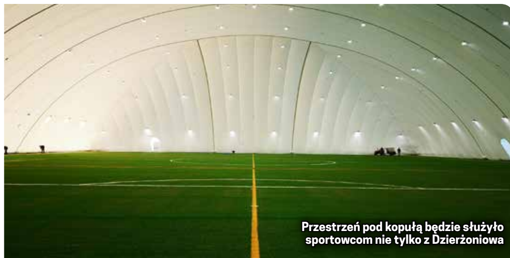
Przestrzeń pod kopułą będzie służyć sportowcom nie tylko z Dzierżoniowa

Kolejne duże inwestycje w sportową infrastrukturę obejmą modernizację dzierżoniowskich basenów.