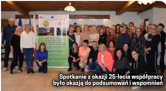
Spotkanie z okazji 25-lecia współpracy było okazją do podsumowań i wspomnień