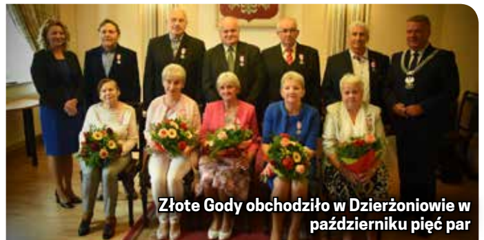
Złote Gody obchodziło w Dzierżoniowie w październiku pięć par

Cztery wyróżnione pary zawierały związki matżeńskie w Dzierżoniowie, jedna w Niemczech. w Urzędzie Stanu Cywilne-