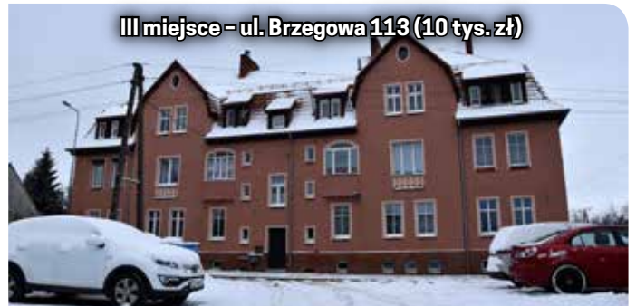
III miejsce - ul. Brzegowa 113 (10 tys. zł)