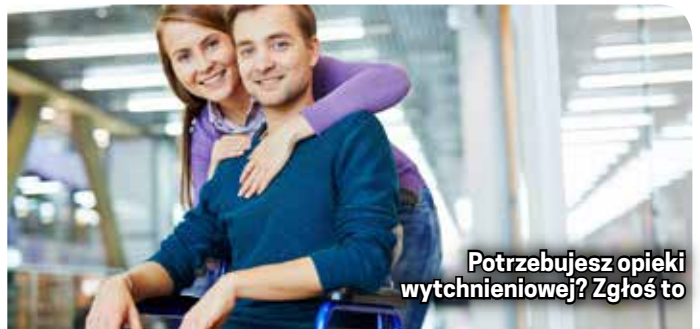
Potrzebujesz opieki wytchnieniowej? Zgłoś to

Osoby zainteresowane tą formą pomocy mogą się kontaktować z dzierżoniowskim OPS-em pod numerem tel. 74 660 49 09 lub 74 660 46 76.