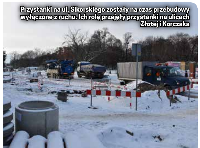
Przystanki na ul. Sikorskiego zostały na czas przebudowy wyłączone z ruchu. Ich rolę przejęły przystanki na ulicach Złotej i Korczaka

inwestycjach na innych drogach pozwoli to na sprawniejsze odprowadzanie wody podczas gwałtownych, dużych opadów.