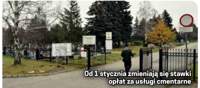
Od 1 stycznia zmieniają się stawki opłat za usługi cmentarne

Komunalnego przy ul. Wrocławskiej w Dzierżoniowie jest miasto, a cmentarz jest miejscem pochówku osób zmarłych bez względu na ich narodowość, wyznanie, światopogląd czy pochodzenie społeczne. Bieżącym utrzymaniem i zarządzaniem