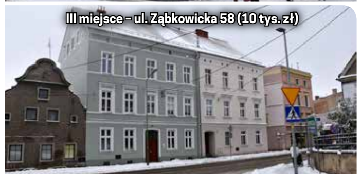
III miejsce - ul. Żąbkowicka 58 (10 tys. zł)