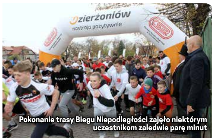
Pokonanie trasy Biegu Niepodległości zajęło niektórym uczestnikom zaledwie parę minut

m. Do udziału zgłosiło się ponad 490 osób, w tym wiele rodzin z dziećmi oraz nastolatków.