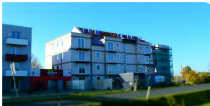
Powstaje czwarty obiekt DTBS-u przy ul. Sowiogórskiej

Koszt budowy wyniesie nieco ponad 9 mln zł. Wszystkie mieszkania mają już swoich najemców.