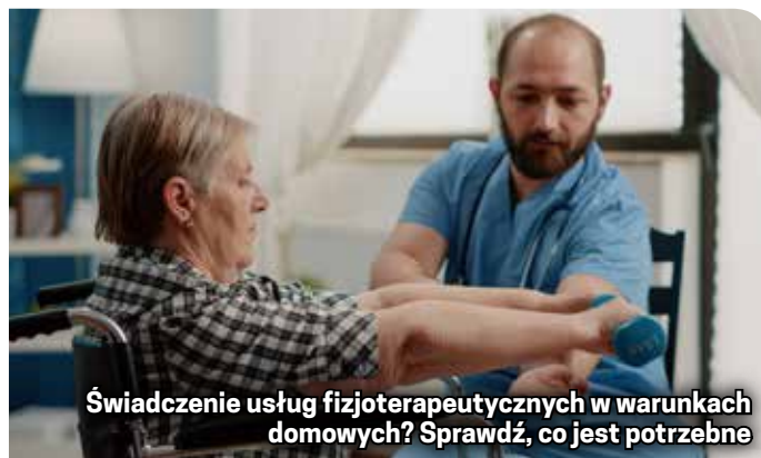
Świadczenie usług fizjoterapeutycznych w warunkach domowych? Sprawdź, co jest potrzebne

Wzór skierowania został zamieszczony na stronie internetowej ośrodka. OPS nie przyjmuje skierowań.