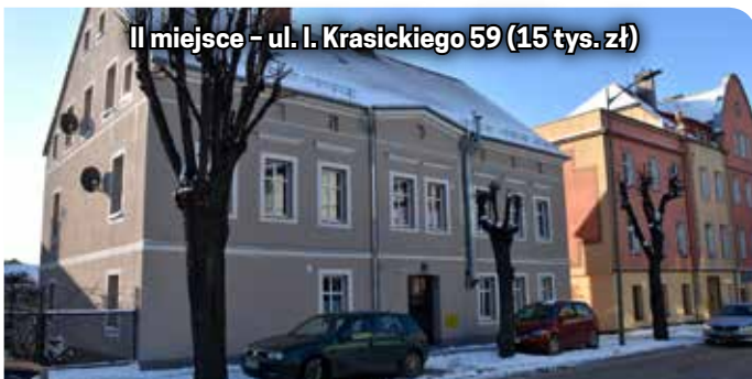
II miejsce - ul. I. Krasickiego 59 (15 tys. zł)