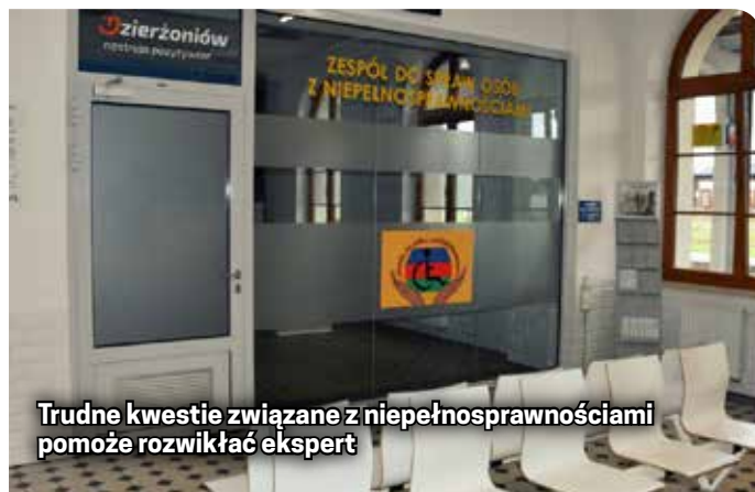
Trudne kwestie związane z niepełnosprawnościami pomoże rozwiązać ekspert

o czym mówią. Zachęcam do tego i serdecznie zapraszam do spotkań osobistych w każdą środę oraz do kontaktu telefonicznego (794 635 643) – mówi Tadeusz Skrzypek.