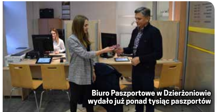
Biuro Paszportowe w Dzierżoniowie wydało już ponad tysiąc paszportów

i udostępnił specjalne łącze, pracownika Ministerstwa Spraw Wewnętrznych i Administracji. Dziś jest ono testowane przez