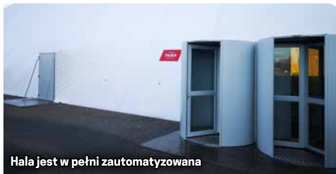
Hala jest w pełni zautomatyzowana

Dzierżoniowa. Dla kogoś, kto nie był w takiej hali, moment wejścia i pierwszy widok robią ogromne wrażenie. W środku jest pełnowymiarowe boisko piłkarskie, na nim są wytyczone trzy mniejsze boiska, które będą przede wszystkim służyć młodzieży z Dzierżoniowa. Korzystać z niego