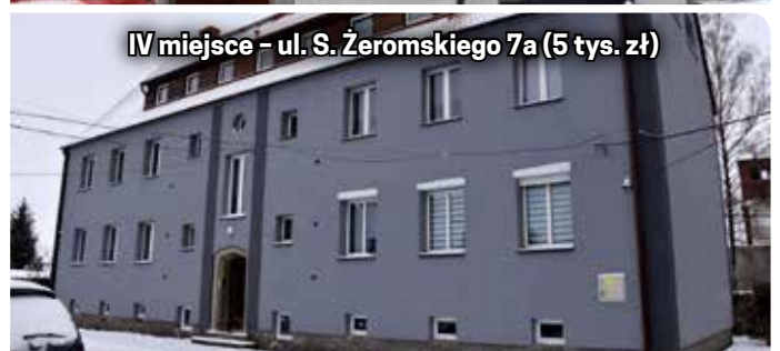
IV miejsce - ul. S. Żeromskiego 7a (5 tys. zł)