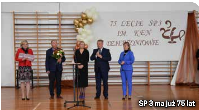
SP 3 ma już 75 lat

Škola Lanškroun obchodzący jubileusz 25-lecia współpracy. Przedstawiciele placówek spotkali się w Stroniu Śląskim, by razem powspominać miniony i bogaty czas wspólnych działań.