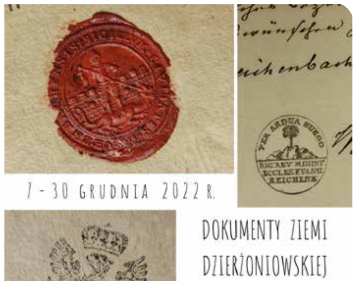
DOKUMENTY ZIEMI DZIERŻONIOWSKIEJ