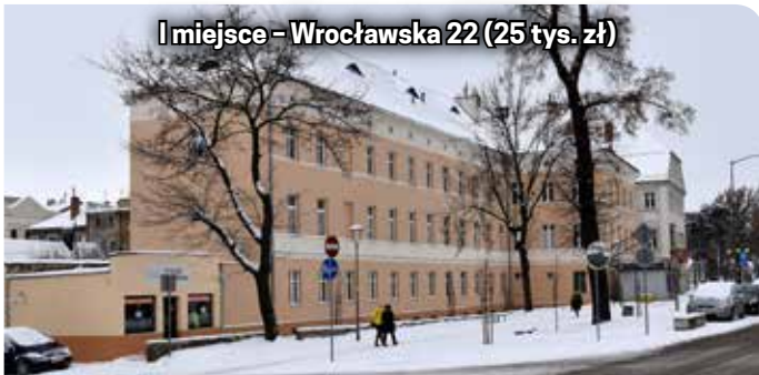
I miejsce - Wrocławska 22 (25 tys. zł)

większe, bo wiem, jak trudno w obecnych czasach przeprowadza się i te duże, i te mniejsze inwestycje – mówi Dariusz Kucharski, burmistrz Dzierżoniowa.