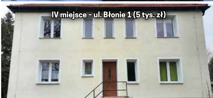
IV miejsce - ul. Błonie 1 (5 tys. zł)