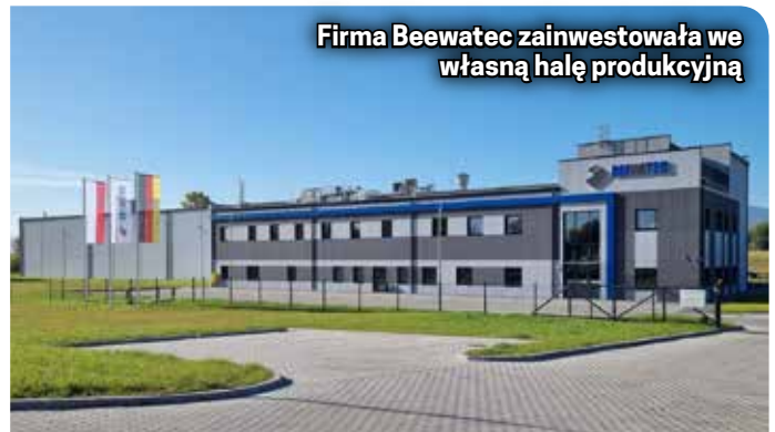
Firma Beewatec zainwestowała we własną halę produkcyjną

- Nowy obiekt ma 3.027 m 2 powierzchni użytkowej, w tej chwili zatrudniamy 32 osoby. Co ważne, mamy własne biuro projektowe, w którym nasi konstruktorzy, bazując na swoim doświadczeniu i zasadach „Lean”, tworzą rozwiązania konstrukcyjne spełniające nawet te najbardziej wygórowane oczekiwania – wyjaśnia