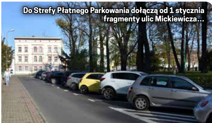
Do Strefy Płatnego Parkowania dołączą od 1 stycznia fragmenty ulic Mickiewicza...

Abonamenty można nabyć w biurze Strefy Płatnego Parkowania przy ul. Nowej 5.