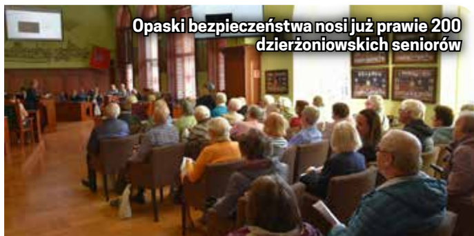
Opaski bezpieczeństwa nosi już prawie 200 dzierżoniowskich seniorów

Warto wiedzieć, że taką opaskę można zakupić samodzielnie. Jej koszt zakupu to około 600 zł, a miesięczny „abonament” na monitoring to około 25 zł. Zakup i opłata abonamentu finansowana jest ze środków z Funduszu Przeciwdziałania COVID-19, w ramach programu „Korpus Wsparcia Seniorów – 2022”.