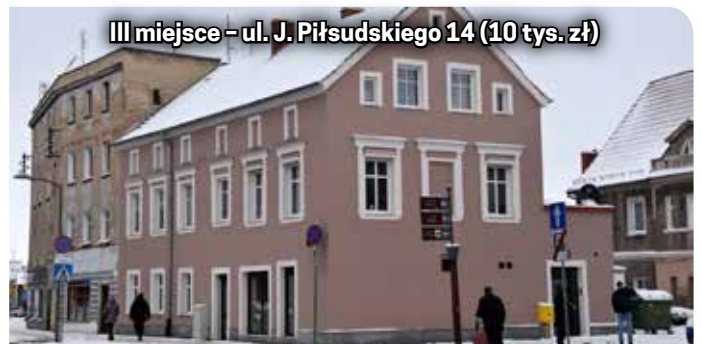
III miejsce - ul. J. Piłsudskiego 14 (10 tys. zł)