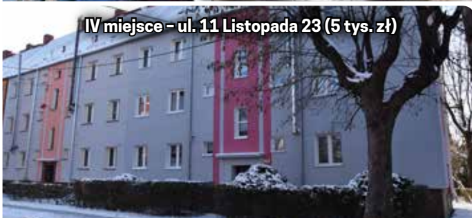
IV miejsce - ul. 11 Listopada 23 (5 tys. zł)