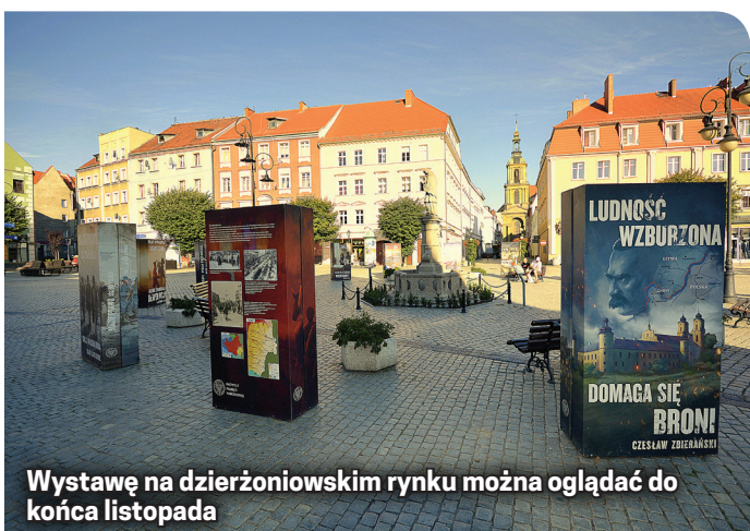
Wystawę na dzierżoniowskim rynku można oglądać do końca listopada

Polski Juniorek oraz dwa medale w grupie kadetek. W klasyfikacji klubowej sportu młodzieżowego w kraju MULKS Junior Dzierżoniów uplasował się na czwartej pozycji w stawce 97 klubów.