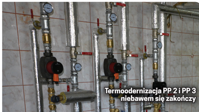
Termomodernizacja PP 2 i PP 3 niebawem się zakończy

W PP 3 zakres prac był jeszcze większy. Objął m.in. naprawę i przebudowę komińców i ogniomurów, wywieńki wentylacyjnych, przebudowę instalacji odgromowej, wymianę obróbek blacharskich, rynien i rur spustowych,