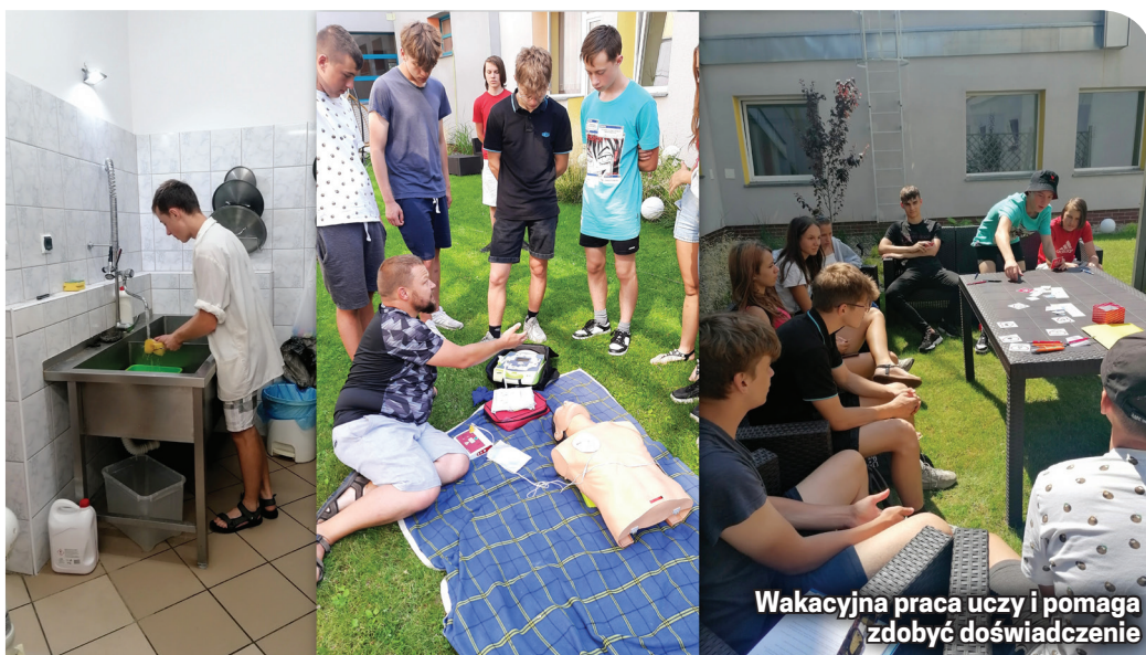
Wakacyjna praca uczy i pomaga zdobyć doświadczenie

Doświadczenie i nowe umiejętności to bezcenne wakacyjne zdobycze młodzieży uczestniczącej w projekcie, która dodatkowo otrzymała za swoją pracę wynagrodzenie - pierwsze samodzielnie zarobione pieniądze.