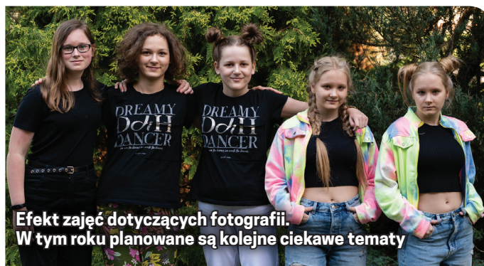
Efekt zajęć dotyczących fotografii. W tym roku planowane są kolejne ciekawe tematy

szą ponownie raz w tygodniu w Szkole Podstawowej nr 9. Planowanych jest wiele ciekawych zajęć poświęconych filmom, ciekawym zawodom i wszystkim tym, co