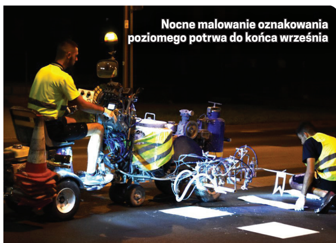
Nocne malowanie oznakowania poziomego potrwa do końca września

Koszt pomalowania jednego metra kwadratowego to, w zależności od rodzaju farby, kwota ok. 10,50 zł. Prace realizowane były w ramach umowy zawartej w 2021 roku. Ich roczny koszt to 105 tys. zł.