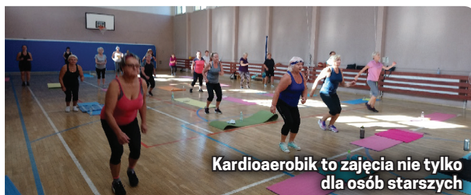
Kardioaerobik to zajęcia nie tylko dla osób starszych

Wstęp na zajęcia współfinansowane przez miasto tylko z kartetem (10 wejść w cenie 40 zł), który można zakupić w re-