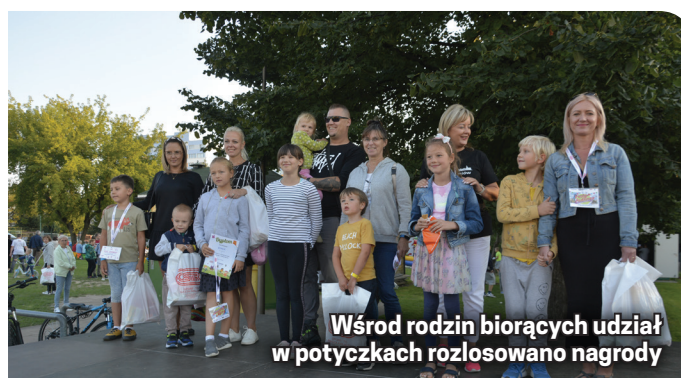
Wśród rodzin biorących udział w potyczkach rozlosowano nagrody