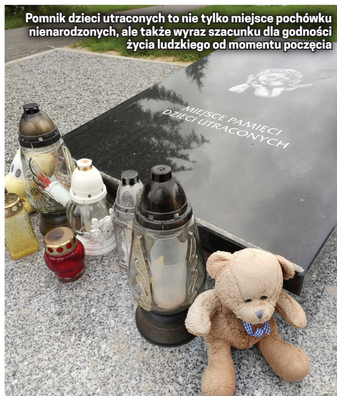
Pomnik dzieci utraconych to nie tylko miejsce pochówku nienarodzonych, ale także wyraz szacunku dla godności życia ludzkiego od momentu poczęcia

Miejsce to jednocześnie przypomina wszystkim o godności życia ludzkiego od momentu poczęcia i uwrażliwia nasze serca na dar przy-