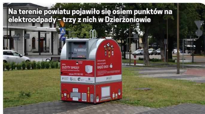
Na terenie powiatu pojawiło się osiem punktów na elektroodpady - trzy z nich w Dzierżoniowie

Projekt „Elektryczne Śmieci”, w ramach którego zamontowano pojemniki, realizowany jest wspólnie przez Związek Gmin Powiatu Dzierżoniowskiego, MB Recycling oraz Fundację Odzyskaj Środowisko.