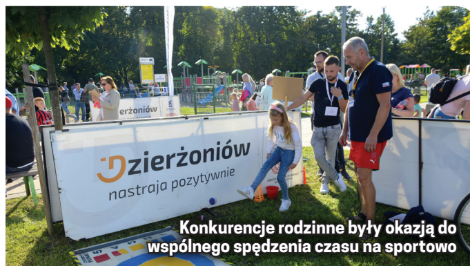
Konkurencje rodzinne były okazją do wspólnego spędzenia czasu na sportowo

Dzień później, na „poprawiny”, przy alei odbył się Festiwal Kolorów. Było to bardzo barwne pożegnanie wakacji w Dzierżoniowie.