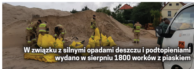
W związku z silnymi opadami deszczu i podtopieniami wydano w sierpniu 1800 worków z piaskiem

Zespołu Zarządzania Kryzysowego dotyczącym sytuacji hydrologicznej na terenie miasta i koordynującym działania odpowiednich służb i inspekcji natychmiast uruchomiono wsparcie dla mieszkańców. Wprowadzono alarm przeciwpowodziowy na terenie Dzierżoniowa. Rozwożono worki z piachem do mieszkańców podtopionych budynków i posesji. Uruchomiono również całonocny numer w Urzędzie Miasta, na który mieszkańcy mo-