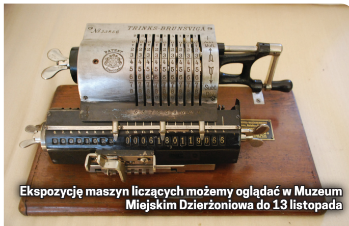
Ekspozycję maszyn liczących możemy oglądać w Muzeum Miejskim Dzierżoniowa do 13 listopada

od tak prozaicznych sytuacji, jak liczenie gotówki w sklepie, porównywanie cen, obliczanie dni, tygodni, miesięcy, lat, godzin czy minut, po te obliczenia bardziej skomplikowane, których dokonywać muszą księgowi, logistycy, geodeci czy architekci. Gdyby się tak zatrzymać i chwilę zastanowić – liczymy coś prawie na każdym kroku. Podstawowym urządzeniem, jakiego używamy do trudniejszych obliczeń,