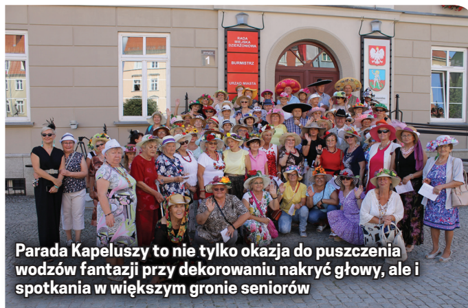
Parada Kapeluszy to nie tylko okazja do puszczenia wodzów fantazji przy dekorowaniu nakryć głowy, ale i spotkania w większym gronie seniorów

odśpiewali kilka pieśni i zapoznawali do pamiątkowej fotografii. Zabawę kontynuowano podczas biesiady w ogrodzie Dziennego Domu Senior+.