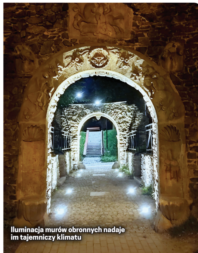
Iluminacja murów obronnych nadaje im tajemniczy klimat