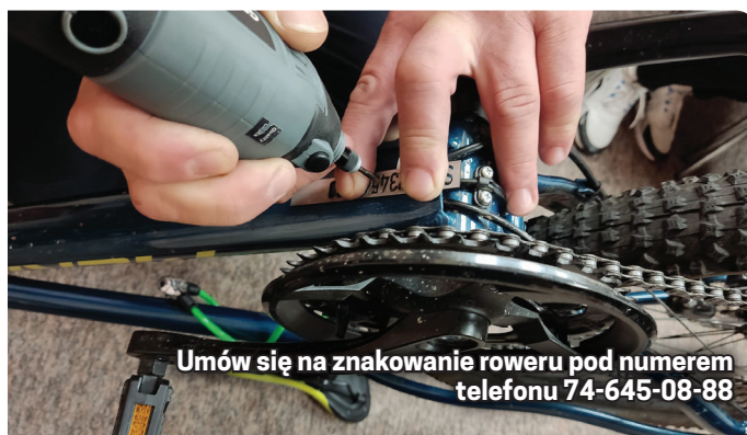
Umów się na znakowanie roweru pod numerem telefonu 74-645-08-88

Znakowanie roweru jest jedną z form zabezpieczenia przed kradzieżą. Pamiętajmy również o dobrym zabezpie-