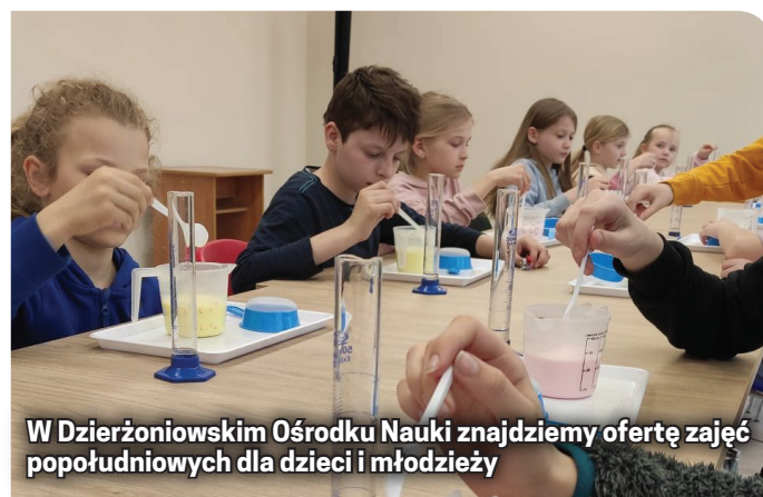
W Dzierżoniowskim Ośrodku Nauki znajdziemy ofertę zajęć popołudniowych dla dzieci i młodzieży

Kontakt telefoniczny do DON-u: 507 770 859, mailowy: don@mbp.dzierżoniow.pl