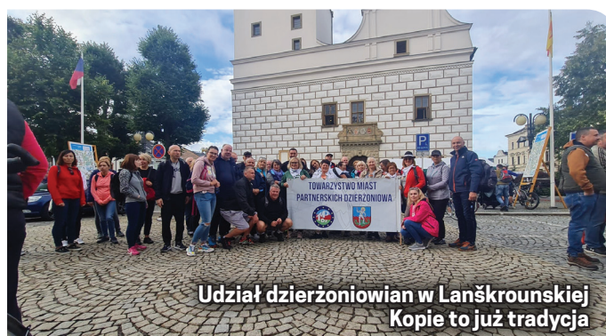
Udział dzierżoniowian w Lanškrounskiej Kopie to już tradycja

mieliśmy też reprezentację biegaczy, którzy na co dzień trenują w Bielawskiej Akademii Biegania. Imprezie tradycyjnie towarzyszyły występy kulturalne i pokaz sztucznych ogni. Była też okazja do spotkania się z delegacją z partnerskiego miasta Serock.