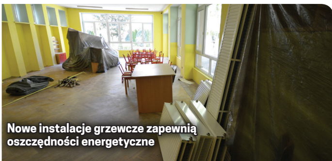
Nowe instalacje grzewcze zapewnią oszczędności energetyczne

Na inwestycje miasto pozyskało dofinansowanie z Regionalnego Programu Operacyjnego Województwa Dolnośląskiego 2014-2020, współfinansowanego z Europejskiego Funduszu Rozwoju Regionalnego. Pierwsza z nich zakończy się maksymalnie w październiku i kosztować będzie prawie 428 tys. zł, druga zaś – 1 mln 556 tys. zł i potrwa do końca listopada.