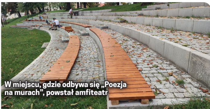
W miejscu, gdzie odbywa się „Poezja na murach”, powstał amfiteatr