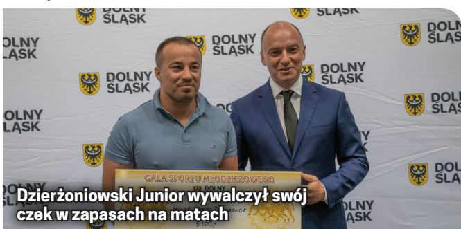
Dzierżoniowski Junior wywalczył swój czepek w zapasach na matach

Polski Juniorek oraz dwa medale w grupie kadetek. W klasyfikacji klubowej sportu młodzieżowego w kraju MULKS Junior Dzierżoniów uplasował się na czwartej pozycji w stawce 97 klubów.