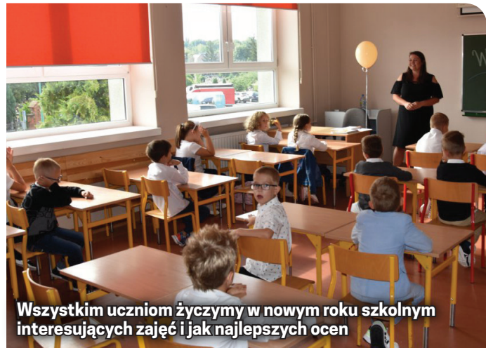
Wszystkim uczniom życzymy w nowym roku szkolnym interesujących zajęć i jak najlepszych ocen

Wraz z uczniami polskimi do szkół i przedszkoli uczęszczają również dzieci z Ukrainy. Jest ich ponad 150 (sytuacja się zmienia ze względu na wyjazdy i przyjazdy rodzin ukraińskich).