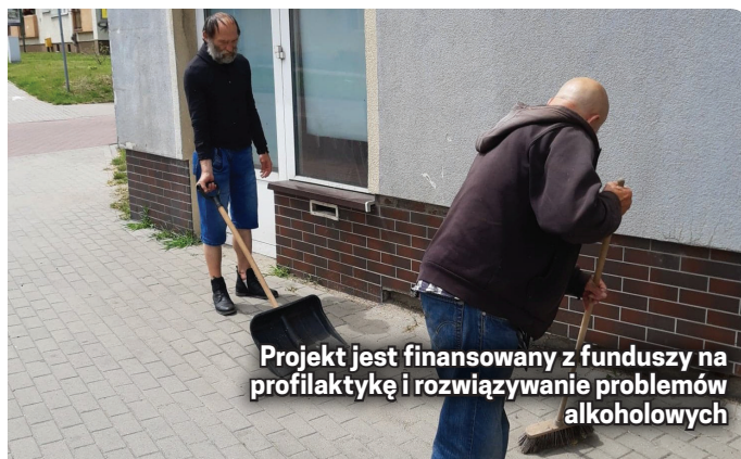
Projekt jest finansowany z funduszy na profilaktykę i rozwiązywanie problemów alkoholowych

Projekt zakłada działania profilaktyczne skierowane do osób bezdomnych oraz zagrożonych bezdomnością. Od stycznia kontynuowane były działania aktywizujące i profilaktyczne na rzecz wychodzenia z bezdomności. Uczestnicy projektu podejmowali prace na rzecz miasta oraz korzystali ze wsparcia specjalisty z zakresu profilaktyki uzależnień. Pracowali m.in. w Centrum Seniora w Dzierżoniowie, Środowiskowym Domu Samopomocy, Przedszkolu Publicznym nr 3, podczas remontu ma-