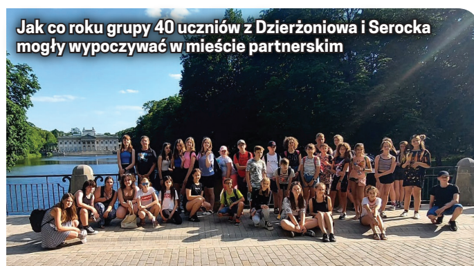
Jak co roku grupy 40 uczniów z Dzierżoniowa i Serocka mogły wypoczywać w mieście partnerskim

wem Zegrzyńskim, poznawali Serock i zwiedzali Warszawę. Takie wymiany uczniów to jeden z głównych elementów trwającej od 2004 r. współpracy Serocka i Dzierżoniowa.