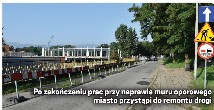
Po zakończeniu prac przy naprawie muru oporowego miasto przystąpi do remontu drogi

Na remont ul. Prochowej i Mierniczej o wartości prawie 8,5 mln zł miasto stara się o dofinansowanie z Rządowego Funduszu Rozwoju Dróg.