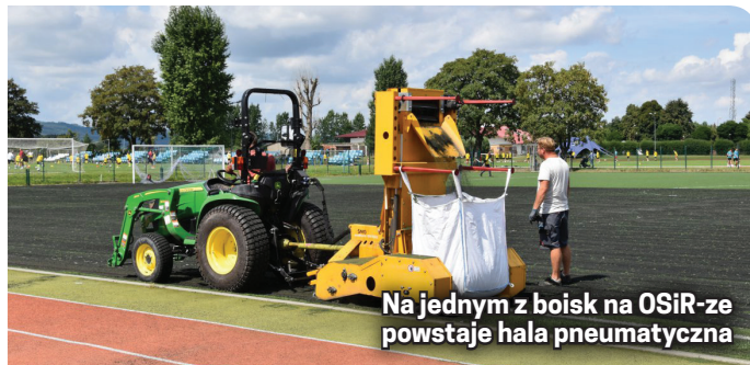
Na jednym z boisk na OSiR-ze powstaje hala pneumatyczna

oraz niezbędną infrastrukturą, jak również wymianę istniejącej murawy boiska piłkarskiego ze sztucznej trawy na nawierzchnię z murawy trzeciej generacji. Wartość inwestycji to 4 mln 980 tys. złotych.