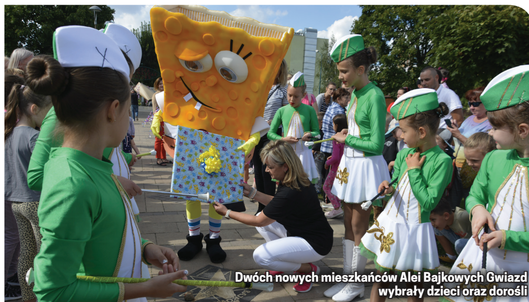
Dwóch nowych mieszkańców Alei Bajkowych Gwiazd wybrały dzieci oraz dorośli