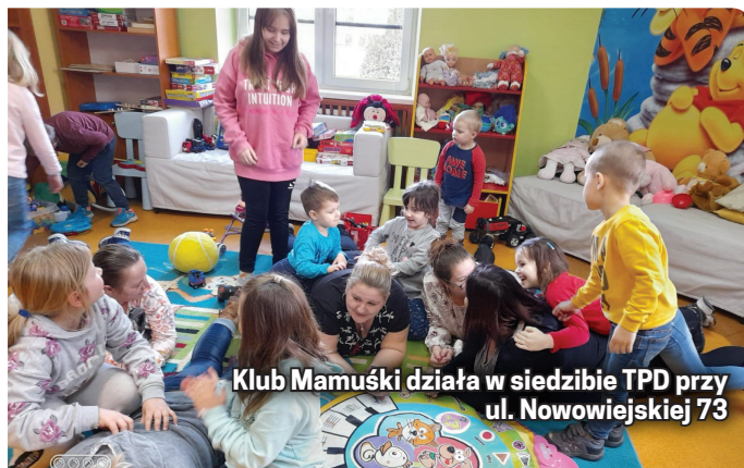
Klub Mamuśki działa w siedzibie TPD przy ul. Nowowiejskiej 73

Po wakacyjnej przerwie klub rusza ponownie w każdą sobotę o godz. 14.00. Zainteresowani mogą kontaktować się z koordynatorem zajęć - Wandą Kunecką - pod numerem 518 27 41 24.