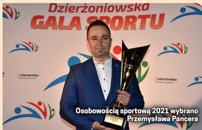
Osobowością sportową 2021 wybrano Przemysława Pancera