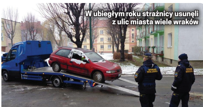
W ubiegłym roku strażnicy usunęli z ulic miasta wiele wraków

Ważnym elementem w działaniach straży miejskiej jest realizacja działań dotyczących ochrony powietrza. Strażnicy miejscy upoważnieni są do kontrolowania, czym dzierżoniowianie palą w piecach, a takie interwen-