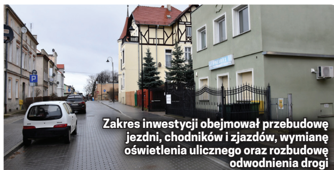
Zakres inwestycji obejmował przebudowę jezdni, chodników i zjazdów, wymianę oświetlenia ulicznego oraz rozbudowę odwodnienia drogi

remontowane od wielu lat. Zadanie to wpisało się w cykl inwestycji zmieniających starówkę Dzierżoniowa i jej najbliższe sąsiedztwo.