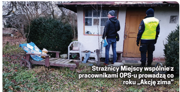
Strażnicy Miejscy wspólnie z pracownikami OPS-u prowadzą co roku „Akcję zima”

Ważnym elementem w 2021 r. było usuwanie z przestrzeni miejskiej wraków zalegających na drogach publicznych. Odnotowano 56 zgłoszeń, usunięto 49 wra-