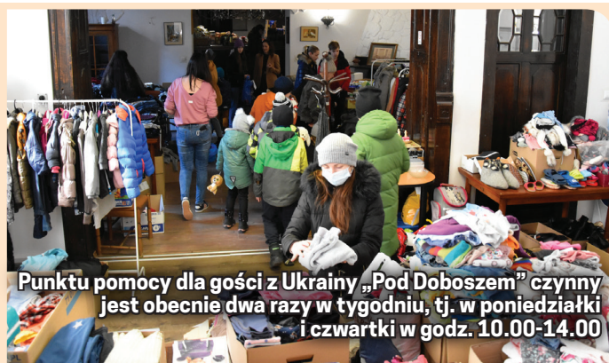
Punktu pomocy dla gości z Ukrainy „Pod Doboszem” czynny jest obecnie dwa razy w tygodniu, tj. w poniedziałki i czwartki w godz. 10.00-14.00

Także od 16 marca Polacy mogą składać wnioski o świadczenia dla osób, które zapewniły uchodźcom zakwaterowanie i wyżywienie. Przyjmuje i rozpatruje je Wydział Gospodarki Nieruchomościami i Architektury Urzędu Miasta w Dzierżoniowie. Kto i na jakich zasadach może uzyskać świadczenie, przeczytasz na stronie 16.