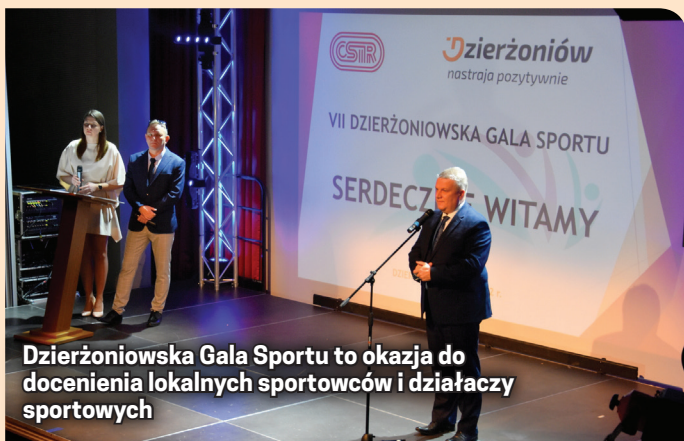
Dzierżoniowska Gala Sportu to okazja do docenienia lokalnych sportowców i działaczy sportowych