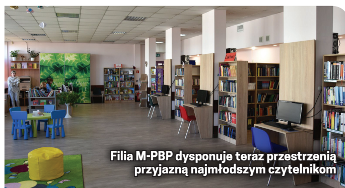
Filia M-PBP dysponuje teraz przestrzenią przyjazną najmłodszym czytelnikom

Zachęcamy do śledzenia strony internetowej biblioteki https://www.mbp.dzierzo-