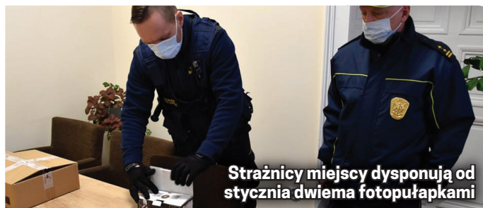
Strażnicy miejscy dysponują od stycznia dwiema fotopułapkami

scach fotopułapki będą montowane. Najważniejszy cel tego zakupu to większa skuteczność właściwego zakończenia spraw prowadzonych przez strażników. Właściwego, czyli takiego, w którym sprawca wykroczenia otrzymuje nadaną przez sąd