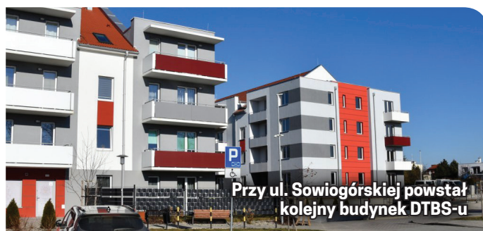
Przy ul. Sowiogórskiej powstał kolejny budynek DTBS-u

rozpoczęła, nie ma jeszcze kompletu najemców. Zainteresowanych zapraszamy do kontaktu z biurem DTBS-u, tel. 74 831 22 60.