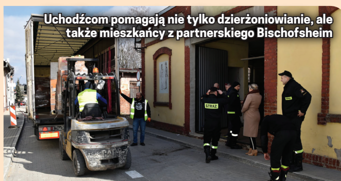
Uchodźcom pomagają nie tylko dzierżoniowianie, ale także mieszkańcy z partnerskiego Bischofsheim

Od 7 marca działa punkt wydawania pomocy „Pod Doboszem” (początkowo czynny codziennie, obecnie dwa dni w tygodniu – w poniedziałki i czwartki w godz. 10.00-14.00).