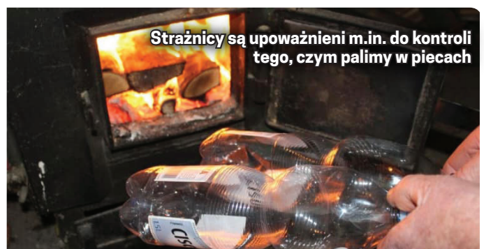
Strażnicy są upoważnieni m.in. do kontroli tego, czym palimy w piecach

Funkcjonariusze dzierżoniowskiej Straży Miejskiej obsługują również miejski monitoring, w którym obecnie działa 29 kamer.