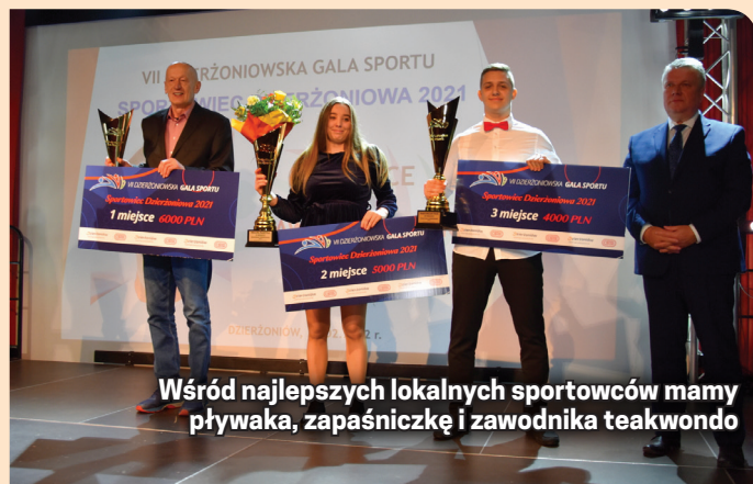
Wśród najlepszych lokalnych sportowców mamy pływaka, zapaśniczkę i zawodnika teakwondo