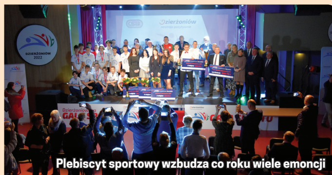
Plebiscyt sportowy wzbudza co roku wiele emocji

Impreza finansowana była z budżetu miasta Dzierżoniów.