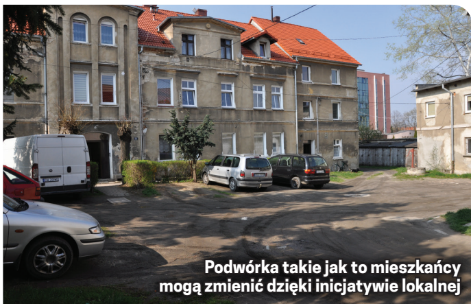
Podwórka takie jak to mieszkańcy mogą zmienić dzięki inicjatywie lokalnej

2020 rok - „Wykonanie chodnika przy ul. Grota Rowckiego 18-24 w Dzierżoniowie”