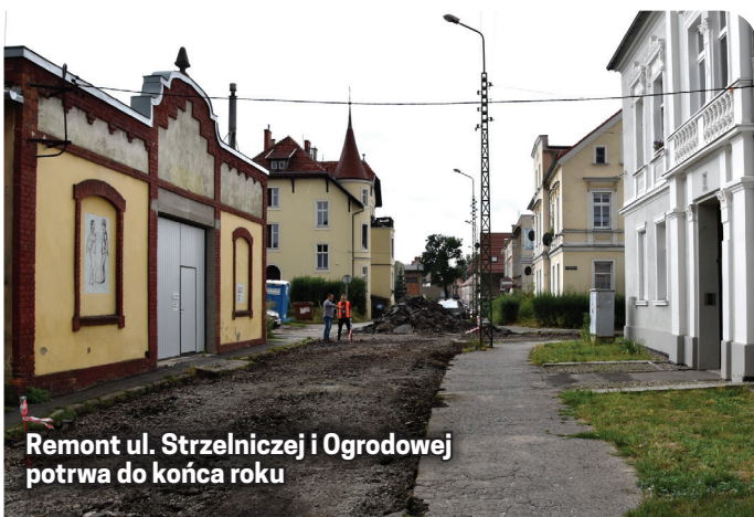
Remont ul. Strzelniczej i Ogrodowej potrwa do końca roku

tować w sprawie inwestycji i sposobu jej realizacji z pracownikami wydziału inwestycji. Pomoc uzyskają Państwo pod numerami telefonów: 74 645 08 83 lub 74 645 08 80.