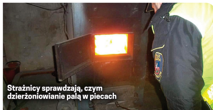
Strażnicy sprawdzają, czym dzierżoniowianie palą w piecach

Funkcjonariusze Straży Miejskiej w Dzierżoniowie są upoważnieni do kontroli posesji na terenie miasta, a jej uniemożliwienie jest prze-