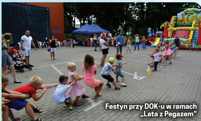
Festyn przy DOK-u w ramach „Lata z Pegazem”

Miasto zadbało o bezpieczny wypoczynek na półkoloniach letnich, które odbyły się w szkołach podstawowych w dwóch turnusach: od 28 czerwca do 2 lipca i od 5 do 9 lipca. W SP 1 uczestniczyło w nich 73 uczniów, w SP 3 - 9, w SP 5 - aż 107, a w SP 9 - 60. Wśród atrakcji były warsztaty lizakowe, ceramiczne, druku 3D, plastyczne, zajęcia profilaktyczne, zabawy ruchowe, wycieczki do Arboretum w Wojstawicach, Kopalni w Nowej Rudzie, Gospodarstwa Agroturystycznego w Marianówku i na Wzgórza Kietczyńskie.