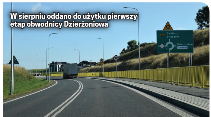
W sierpniu oddano do użytku pierwszy etap obwodnicy Dzierżoniowa

Dobre wiadomości dotyczą także drugiego etapu tego zadania. Jest już decyzja środowiskowa niezbędna do wydania pozwolenia na budowę, więc formalności związane z jej rozpoczęciem powinny być kwestią najbliższych tygodni. Drugi etap obejmuje odcinek od drogi Dzierżoniów-Pieszycy do drogi Dzierżoniów-Bielawa. Ten odcinek buduje firma Polbud-Pomorze Sp. z o.o. Prace idą zgodnie z harmonogramem, a umowy termin ich zakończenia to 8 września 2023 r. Wartość tej inwestycji