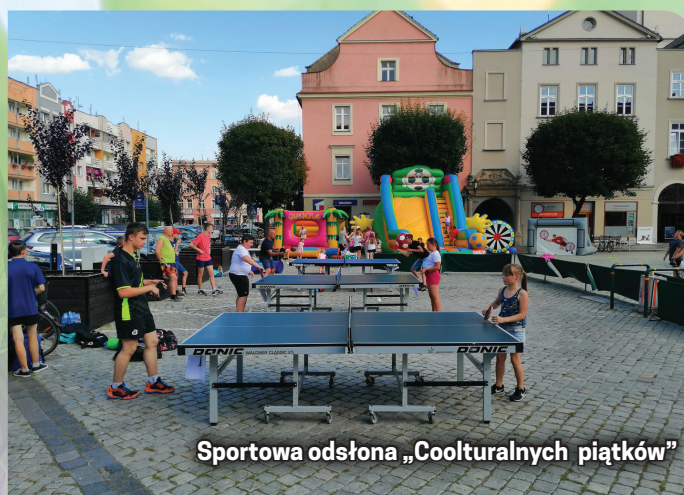
Sportowa odsłona „Coolturałnych piątków”

Wiele się działo również na Alei Bajkowych Gwiazd. Odbywały się zajęcia cykliczne, tj: gimnastyka dla każdego, zabawy animacyjne dla dzieci, Grand Prix w Siatkówce Plażowej, joga na trawie, zajęcia medytacyjne. Były też atrakcje dodatkowe, np. pokaz iluzji, festiwal kolorów, teatryki, malowanie twarzy, gry i zabawy piknikowe, zabawa z seniorami, zumba dla dzieci, warsztaty ceramiczne i pokazy cyrkowe.