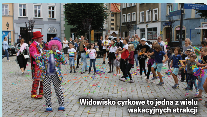
Widowisko cyrkowe to jedna z wielu wakacyjnych atrakcji

Półkolonie w ramach świetlic środowiskowych prowadziło latem także Towarzystwo Przyjaciół Dzieci Oddział Miejski w Dzierżoniowie. 58 dzieci uczestniczyło w wycieczkach, zajęciach plastycznych i ruchowych na świeżym powietrzu.