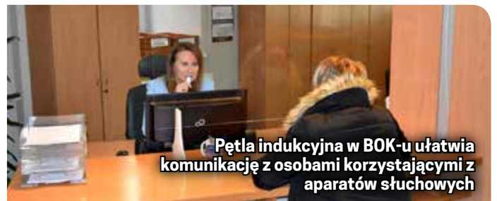
Pętla indukcyjna w BOK-u ułatwia komunikację z osobami korzystającymi z aparatów słuchowych

komunikacji cyfrowej. Strona miasta www.dzierzonow.pl i Biuletyn Informacji Publicznej są od dłuższego czasu dostosowane do standardów WCAG2.1, czyli wytycznych dotyczących dostępności cyfrowej, umożliwiających korzystanie ze strony osobom ze specjalnymi potrzebami oraz możliwością korzystania z czytników tekstu.