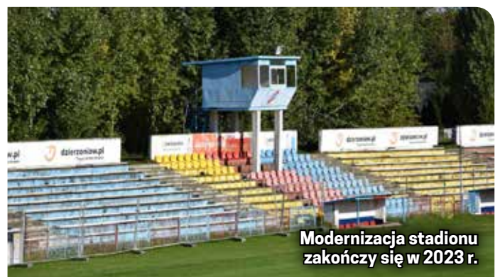
Modernizacja stadionu zakończy się w 2023 r.