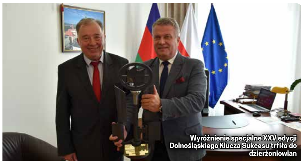
Wyróżnienie specjalne XXV edycji Dolnośląskiego Klucza Sukcesu trafiło do dzierżoniowian

zieleni, działania organizacji pozarządowych, szczególnie Towarzystwa Miłośników Dzierżoniowa, dzięki którym powstają aleje lilaków oraz indywidualne starania mieszkańców w dbaniu o zieleni, które co roku widzimy podczas finału konkursu Piękno Kwiatów i Zieleni Wokół Nas.