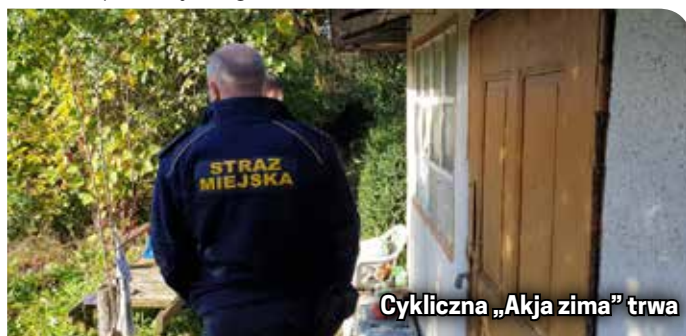
Cykliczna „Akcja zima” trwa

Ogrzewalnia znajduje się przy ul. Nowowiejskiej 91 i czynna przez siedem dni w tygodniu w godzinach 18.00-8.00.