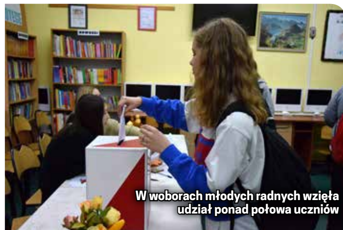
W woborach młodych radnych wzięła udział ponad połowa uczniów

trzech przedstawicieli SP 1, SP 5, SP 9, ZS nr 2 oraz po dwóch przedstawicieli SP 3, ZS nr 1 i 3 oraz I LO, a także przedstawiciel II LO.