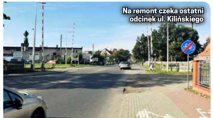
Na remont czeka ostatni odcinek ul. Kilińskiego

drogi wojewódzkiej wymagający remontu. Będzie to jednak trudna i czasochłonna inwestycja. Powodem jest „kumulacja” sieci przebiegających pod tą drogą. Wszystkie zostaną wymienione na nowe, aby przez następne kilkanaście lat nie było konieczności ingerencji w nową nawierzchnię. Sporym wyzwaniem technologicznym