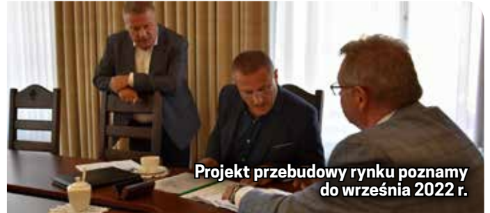
Projekt przebudowy rynku poznamy do września 2022 r.