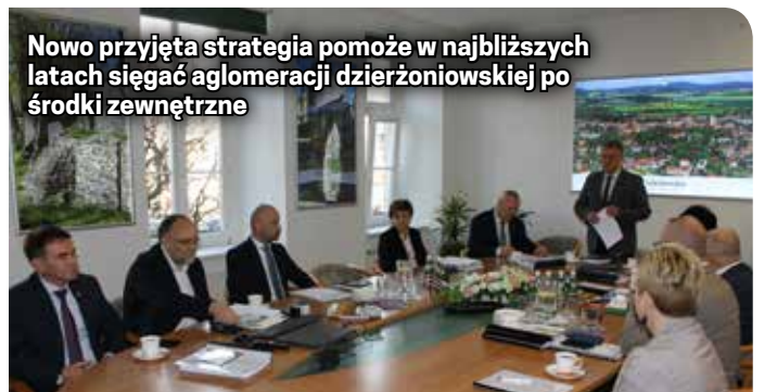
Nowo przyjęta strategia pomoże w najbliższych latach osiągnąć aglomeracji dzierżoniowskiej po środki zewnętrzne

kultury, usług społecznych, gospodarki, cyfryzacji, bezpieczeństwa i zarządzania.