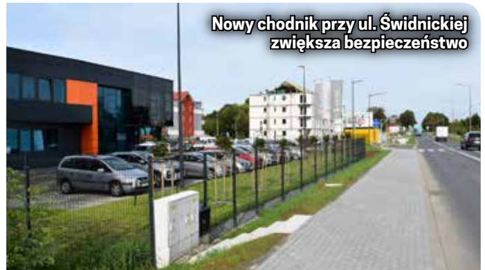
Nowy chodnik przy ul. Świdnickiej zwiększa bezpieczeństwo

mocno się zmienia. Trwa budowa kolejnego budynku DTB-su, trzeciego już w tym miejscu, a będzie kolejny. Niedawno swoją siedzibę uruchomiła tu Polska Spółka Gazownictwa.