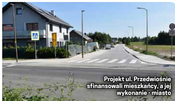
Projekt ul. Przedwiośnie sfinansowali mieszkańcy, a jej wykonanie - miasto

zamknął się kwotą 777 tys. 513 zł brutto.