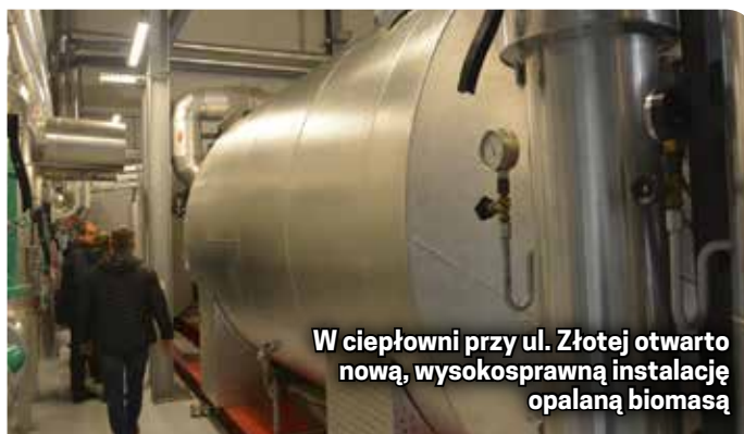
W ciepłowni przy ul. Złotej otwarto nową, wysokosprawną instalację opalaną biomasą

Dla mieszkańców miasta oznacza to dużo czystsze powietrze i niższe ceny ogrzewania i ciepłej wody. Dzięki instalacji na biomasę latem cała ciepła woda dla Dzierżoniowa produkowana jest wyłącznie z czystej energii.