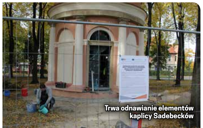
Trwa odnawianie elementów kaplicy Sadebecków

został też podświetlony. Wydana również zostanie polsko-czeska ulotka o kaplicy z informacjami nt. rodziny Sadebecków dla polskich i czeskich turystów, m.in. z naszego miasta partnerskiego Lanškroun.