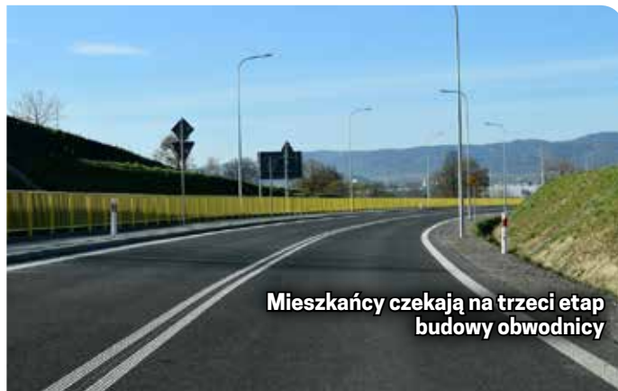
Mieszkańcy czekają na trzeci etap budowy obwodnicy

minął 16 listopada. Do czasu publikacji „Gońca” DSDiK nie przekazała żadnych informacji na temat liczby ofert i wyboru wykonawcy zadania.