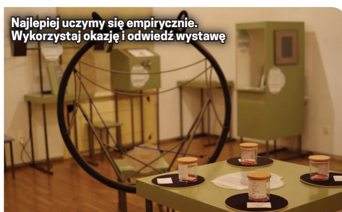
Najlepiej uczymy się empirycznie. Wykorzystaj okazję i odwiedź wystawę

O tym wszystkim można się przekonać na własnej skórze. Praktycznie każdy ekspozytat wystawy jest przygotowany w taki sposób, by widz sam na sobie mógł przeprowadzić doświadczenie.