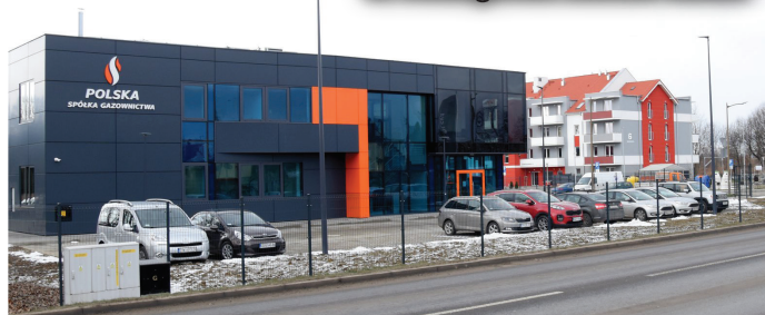
Ul. Sowiogórska zmienia oblicze

W najbliższej przyszłości rozwiązany zostanie najpilniejszy problem komunikacyjny. Wzdłuż ul. Świdnickiej (od ul. Sowiogórskiej do przejścia dla pieszych przy markecie i stacji paliw) miasto wybuduje chodnik. Rozważany jest także montaż sygnalizacji świetlnej na skrzyżowaniu ul. Świdnickiej, Złotej i Sowiogórskiej lub instalacja aktywnych przejść dla pieszych w sąsiedztwie skrzyżowania.