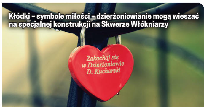
Kłódki - symbole miłości - dzierżoniowianie mogą wieszać na specjalnej konstrukcji na Skwerze Włókniarzy