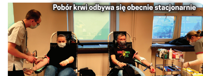
Pobór krwi odbywa się obecnie stacjonarnie

Tylko pierwszego dnia poboru w nowym miejscu zgło-